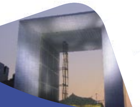
600 m 2 dans la Grande Arche de la Défense

Ainsi, vos collaborateurs sont autonomes et assurés de pouvoir continuer leur formation en toute circonstance, même en déplacement.